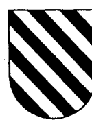
Coticé de 10 pièces