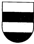
Fascé de 4 pièces