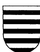
Burellé de 10 pièces