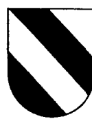
Bandé de 4 pièces