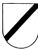
Cotice en barre