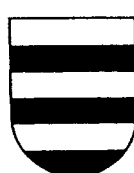
Fascé de 6 pièces