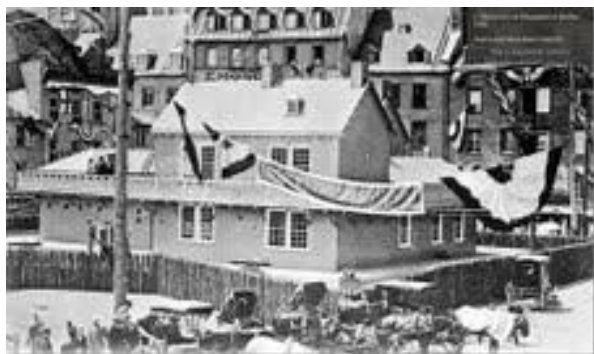
300 e de Québec

Textes et photos proposés par Francine Vachon